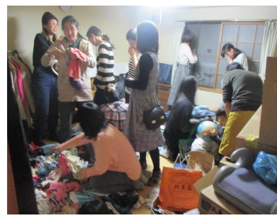
<おさがり会(衣服提供)>