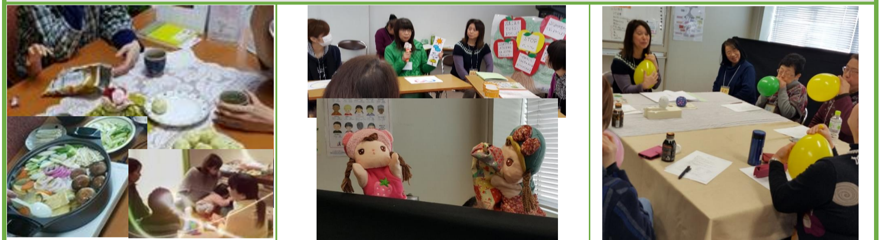
母と子のおしゃべりサロン びーらぶプログラム子プロ パペットショー「いじめ」 「家庭や地域での暴力防止講座」支援者母プロ体験