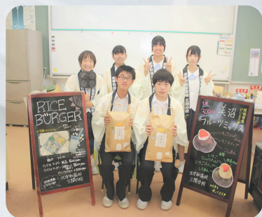
愛媛県立北宇和高校 三間分校 地域情報ビジネス部