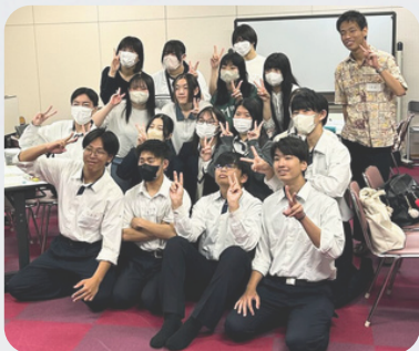
大分県立大分東高校/大分国際情報高校

三間地域の特産品「みま米」で作る、贅沢ライスバーガー!三間分校の高校生たちが先生になって、クッキング教室を開きました。できたてのライスバーガーは絶品。農林水産省及び内閣官房「ディスカバー農山漁村(むら)の宝」奨励賞を受賞しました。