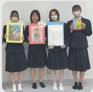
愛媛県立宇和島東高校