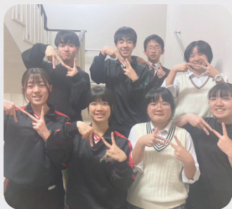
愛媛県高校生サークルNジオチャレ

予土線と大分県のローカル線の魅力を「すごろく」で楽しく伝えました。会場内に線路をはりめぐらせた大きな「すごろく」は大人にも喜ばれました。高知県と愛媛県、大分県の高校生と制作した「旅する本」の展示も行いました。